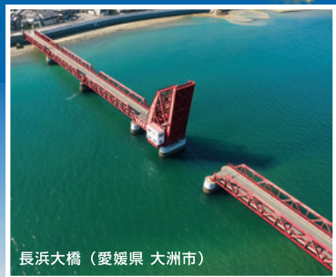
長浜大橋（愛媛県 大洲市）