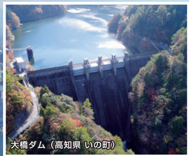
大橋ダム（高知県 いの町）