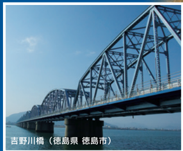
吉野川橋（徳島県 徳島市）