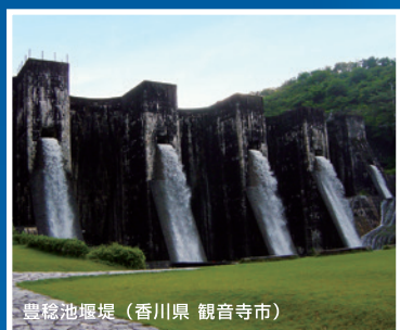
豊稔池堰堤（香川県 観音寺市）