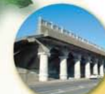
北防波堤ドーム(稚内市)

平成22年9月1日(水)・2日(木)・3日(金) 会場 北海道大学札幌キャンパス 主催 土木学会平成22年度全国大会実行委員会