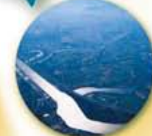
生振捷水路(石狩市)