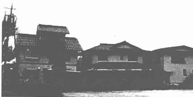
写真-1 安倍彦名団地における液状化による家屋の傾斜被害