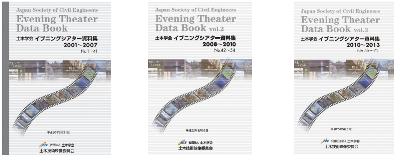
写真-1 Evening Theater Data Book vol.1～vol.3 注)

土木学会土木技術映像委員会では、官公庁、企業、各種団体などで数多く制作されている土木技術に関する映像作品を、企画・表現・内容・作品など多様な視点から評価し、一定の価値を有すると認められる作品を選定する「土木技術映像選定制度」を設けている。当委員会では選定審査会を設け、応募作品に対して随時審査を行っている。選定映像は、2001年からスタートした一般公開の映画会「土木学会イブニングシアター」において(2ヶ月に1度のペースで開催(平成26年3月現在78回))随時上映し、学会員のみならず一般の方々にも好評を得ている。これまで上映した選定映像は100作品を超え、上映ごとに実施するアンケートは貴重な意見である。この「イブニングシアターアンケート」を取りまとめた資料集は、Evening Theater Data Bookとして現在3冊に至っている(非売品)(写真-1)。