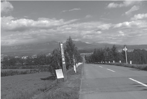
写真1 北海道上富良野町。自転車に乗りながら十勝岳の美しい景色を楽しめる

グをしながらガイドをしたいと思っ たのです。ヨーロッパでは、サイクリ ングガイドという自転車で移動する 観光の仕事がありました。それを思 い出し、日本でサイクリングガイド の仕事をしている会社でアルバイト をしようと思いましたが、しかし、実際 に運営している企業は北海道にはなく、 日本でも2、3社のみでした。北海道 は、自転車乗りにとってこんなにもす ばらしい場所なのにガイドがないのか と残念に思うのと同時に、そのような 企業がないなら自分でつくろうと思い、 起業しました。思い立ってから、2週間 くらいで開業届を出したかな。もちろ ん起業に対して迷いはあったのですが、 ここで引いてしまつてはダメだと思