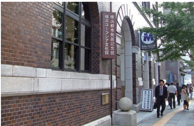
横浜高速鉄道みなとみらい線出口に直結の横浜都市発展記念館