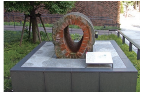
中庭の卵型下水道管