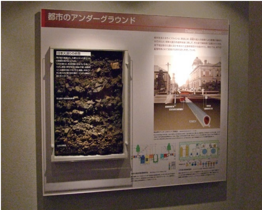
日本大通りの舗装断面