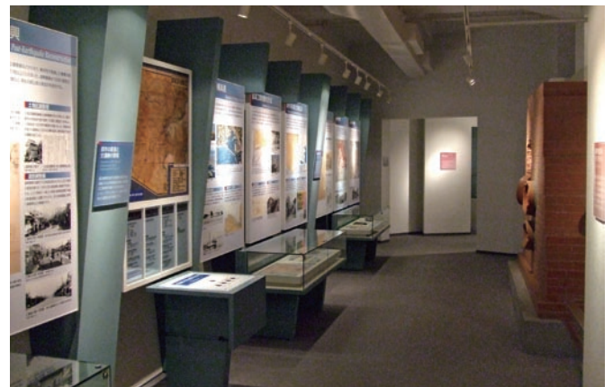
「都市形成」に関する展示パネル