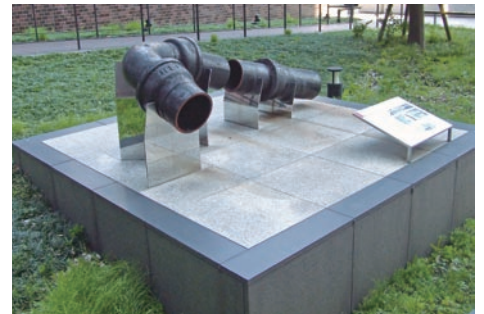
中庭の国内最古のガス管