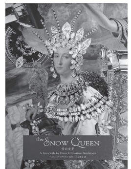
アンデルセン 「THE SNOW QUEEN / 雪の女王」 プチグラパブリッシング