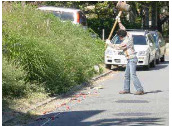
031029_s_009.jpg 2003/10/29 11:46:07