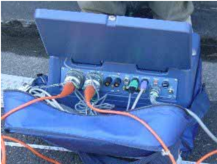
031029_s_005.jpg 2003/10/29 11:41:14