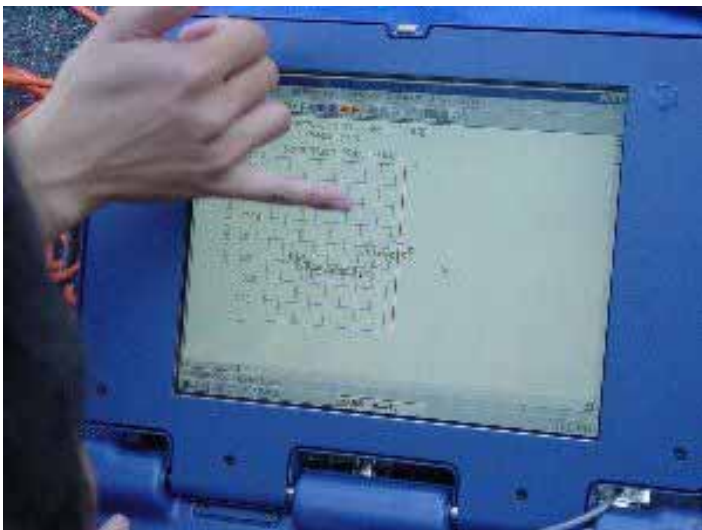
031029_s_010.jpg 2003/10/29 12:06:50