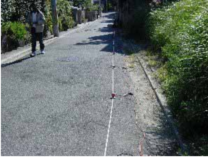
031029_s_002.jpg 2003/10/29 11:36:54