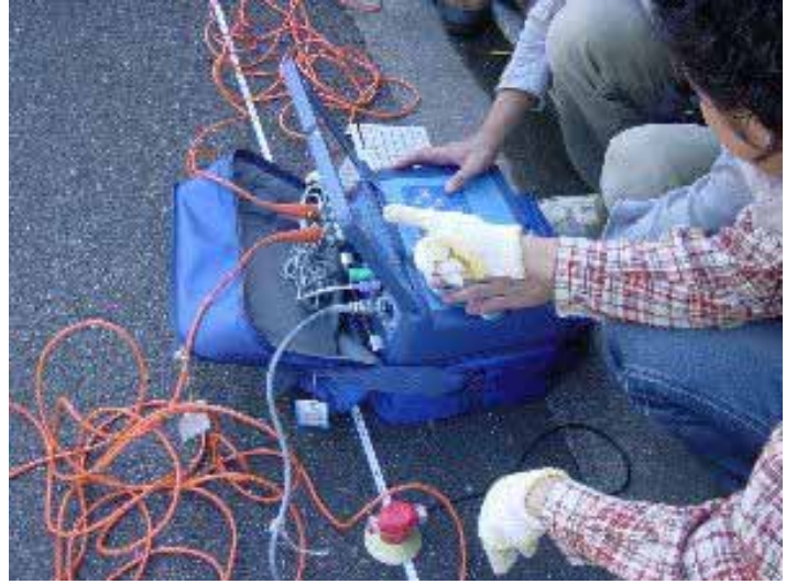
031029_s_004.jpg 2003/10/29 11:40:29