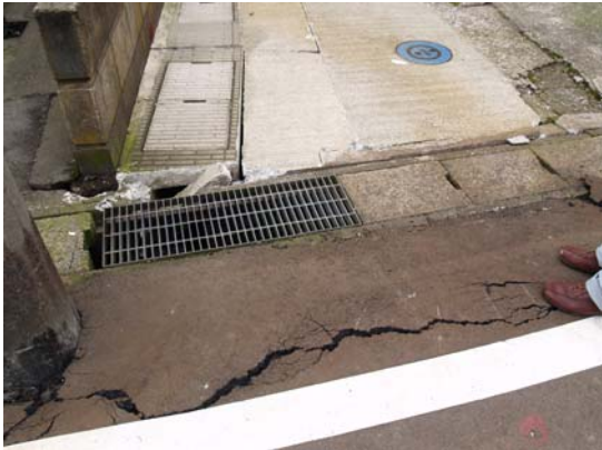
図 7-1 砂丘の頂部付近の引っ張りクラック