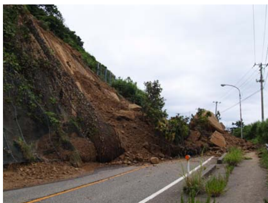
図 9-1 斜面崩壊