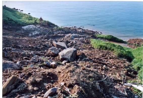
図 12-3 崩壊地下部