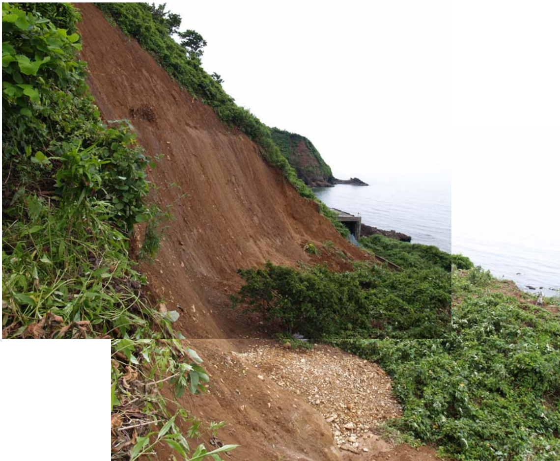
写真 5-3 斜面崩壊の近景