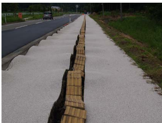
写真 2-1 歩道表面が波打つ