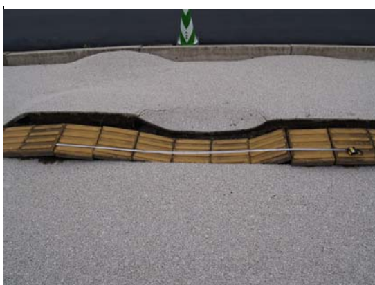
写真 2-2 波長は約 2.2m、片振幅は、10cm から 30cm 程度