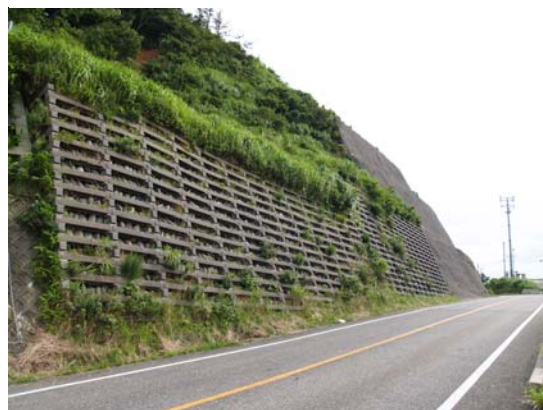
図 9-4 井桁よう壁の変形