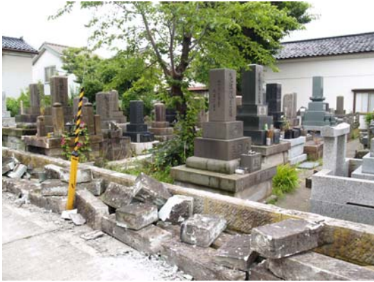
図 7-7 墓石はほとんど転倒していないが、墓を囲むブロック積みの壁が倒壊