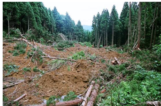
図 11-2 谷内に堆積した崩土