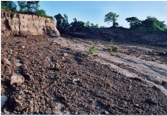
図 12-2 崩壊地上部