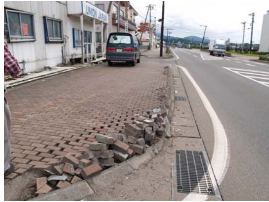
図 7-8 砂丘の海側道路の圧縮変形