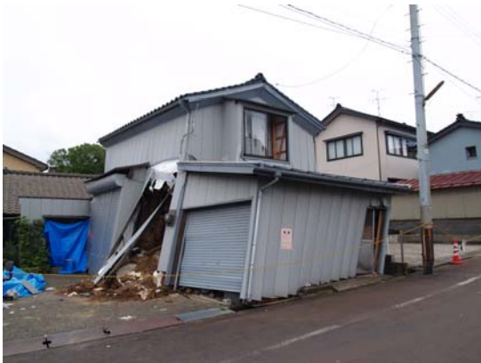
図 7-3 被災家屋の多くはすべり方向、砂丘頂部に向いて傾く