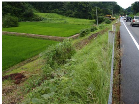
写真 1-2 道路法面における小崩壊