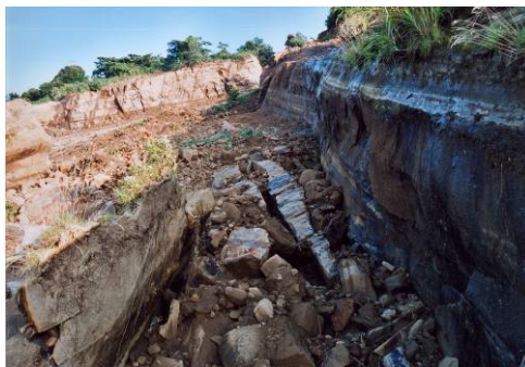
図 12-4 岩盤崩壊の側方（節理面から破断したとみられる）