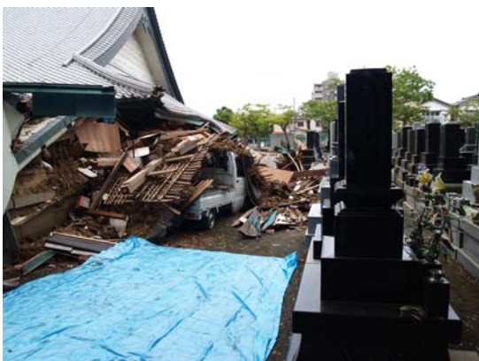
図 7-5 お寺の崩壊と近傍の墓石