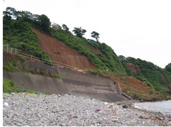
写真 5-2 JR 青海川駅の斜面崩壊(2)