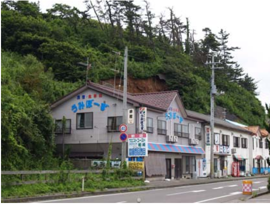
図 6-1 モルタル吹きつけ面の崩壊