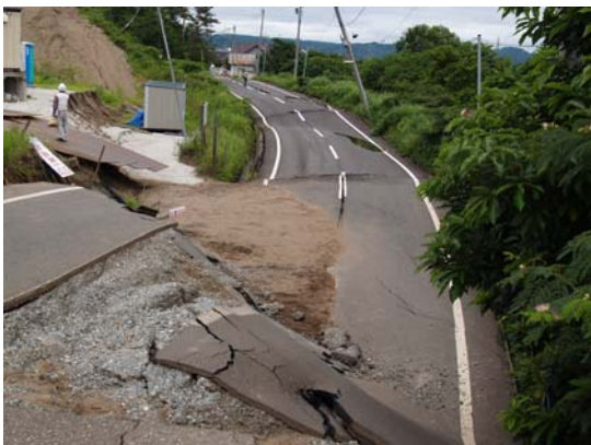
図 8-1 すべり破壊により大きく陥没