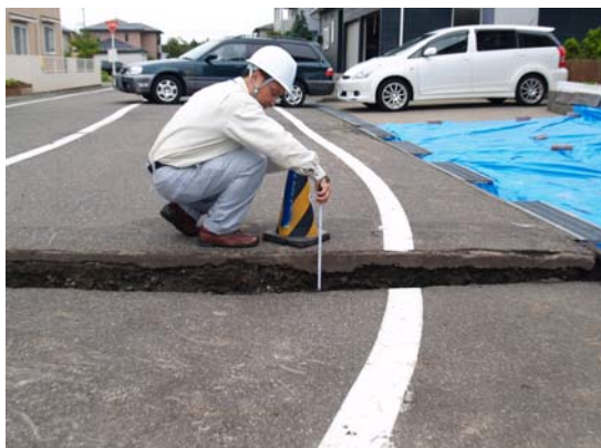
写真 3-1 道路の沈下（約 20cm）