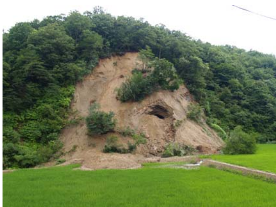
写真 1-1 砂岩風化帯の表層崩壊