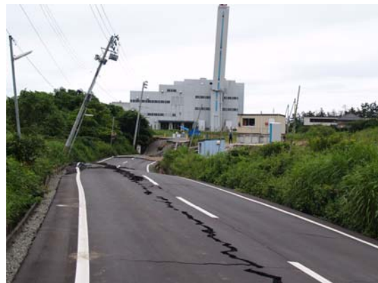
図 8-2 陥没していない道路のセンターラインに亀裂