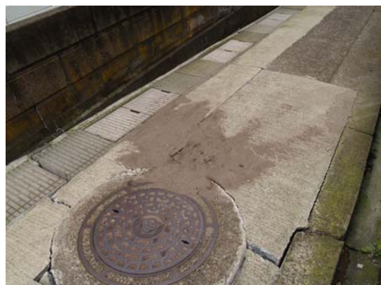
図 7-6 砂丘の陸側のマンホール付近の噴砂