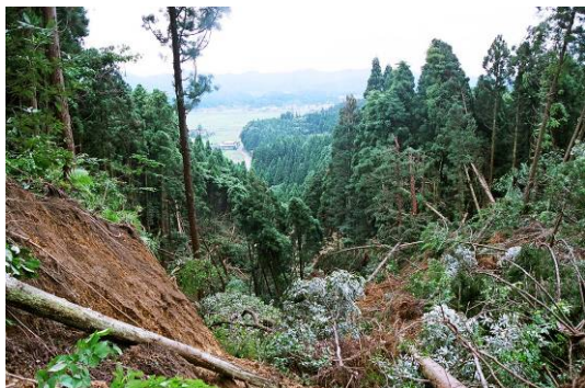
図 11-1 崩壊地上部