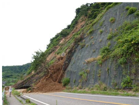
図 9-2 斜面崩壊