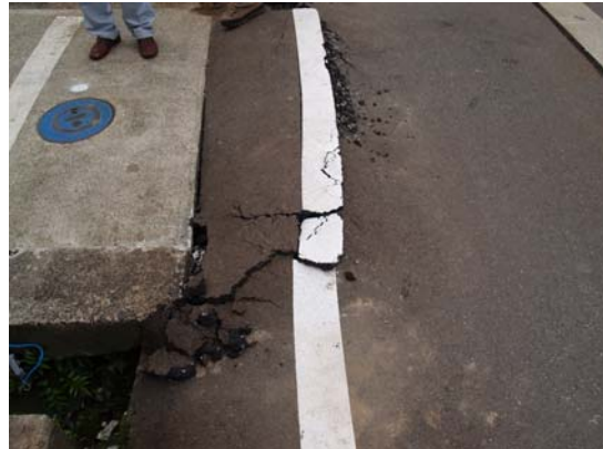
図 7-2 砂丘のへりでは圧縮変形