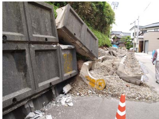
図 7-4 よう壁が崩壊する（東港町）