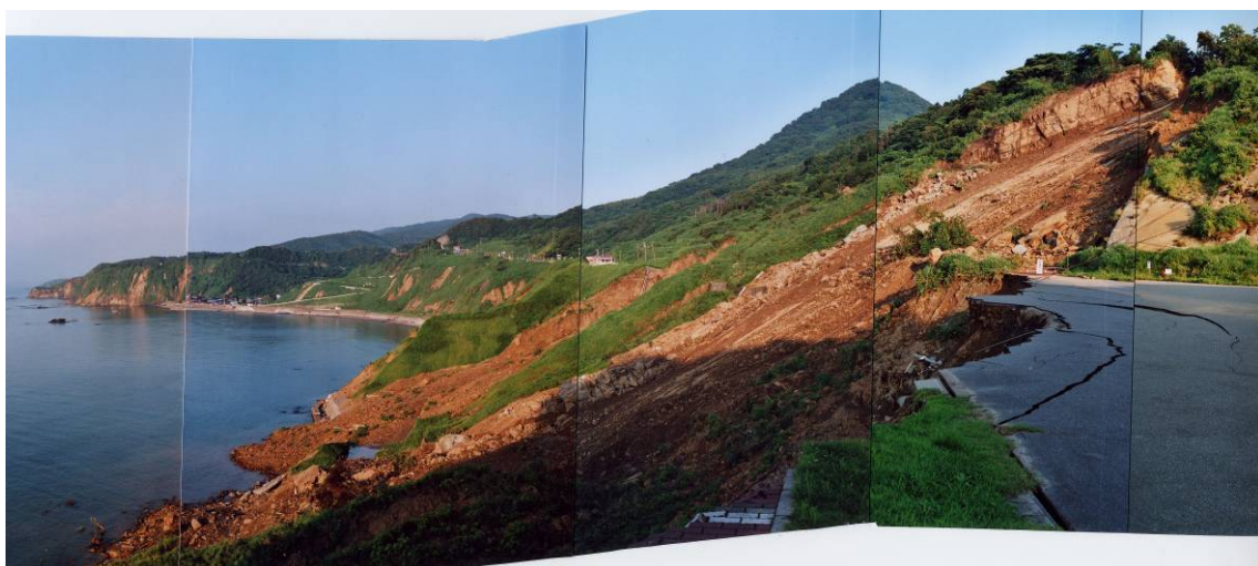
図 12-1 層理面に沿った岩盤崩壊