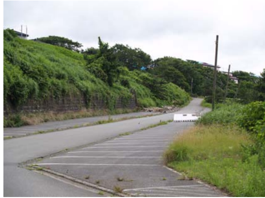
図 6-2 ブロック積みよう壁の傾動・倒壊