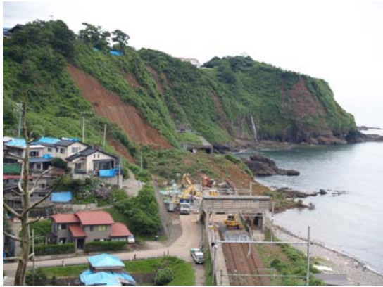
写真 5-1 JR 青海川駅の斜面崩壊(1)