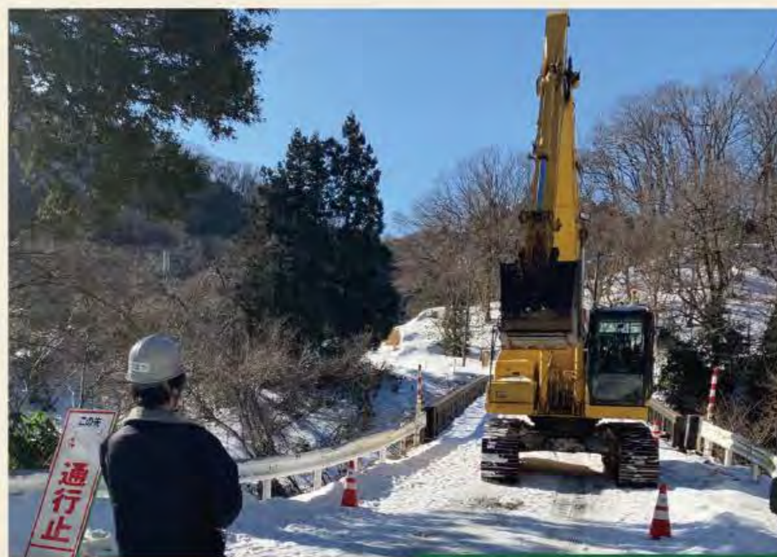
遠隔操作施工機械を用いた応急復旧