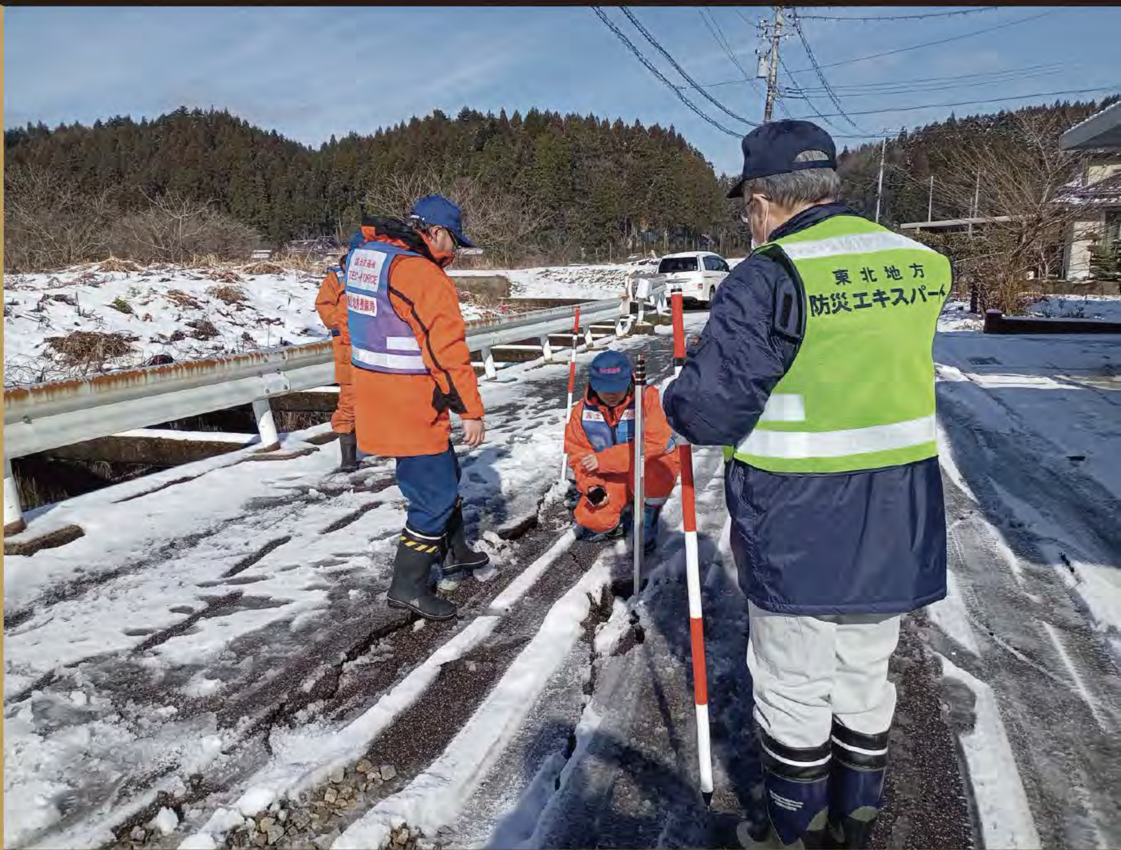
令和6年能登半島地震における活動