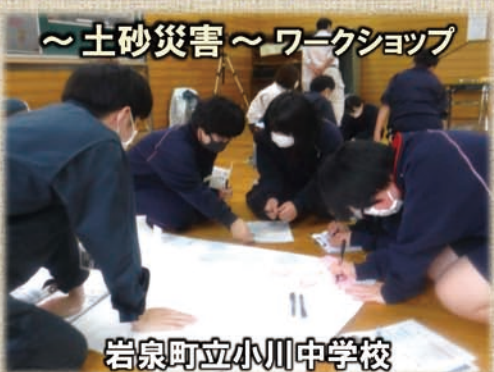
～土砂災害～ワークショップ