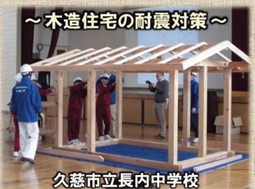
～木造住宅の耐震対策～