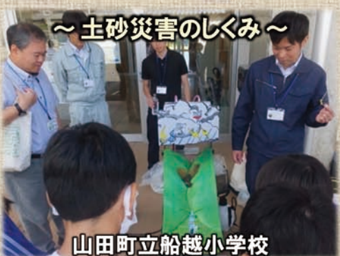
～土砂災害のしくみ～