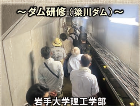
～ダム研修(築川ダム)～