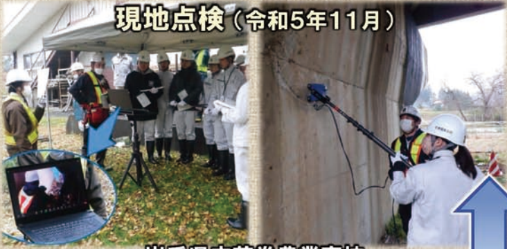
現地点検 (令和5年11月)