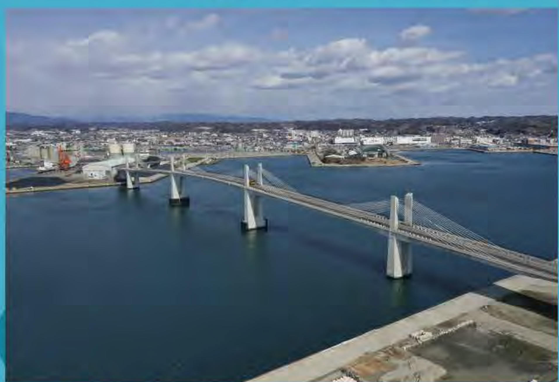
小名浜マリンブリッジ

アクセス 福島県いわき市小名浜字辰巳町43-1 (いわき・ら・らミュウ1f) 車 ●常磐自動車道いわき湯本ICから約20分 バス JR泉駅から約20分