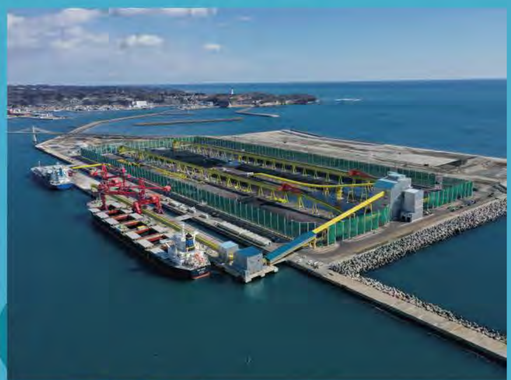
国際バルクターミナル