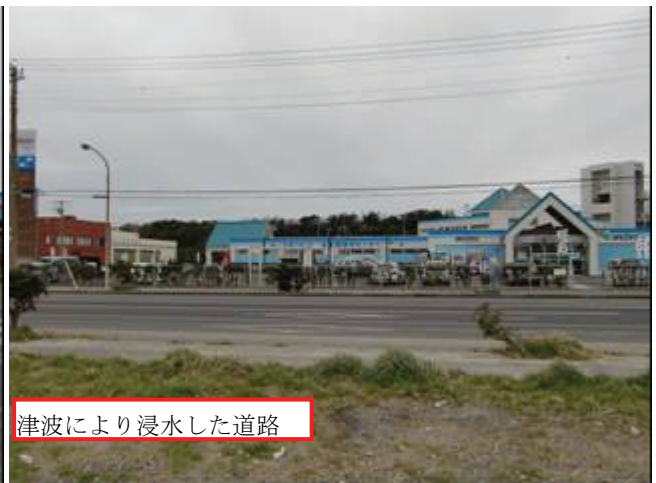
写真9 第3魚市場付近