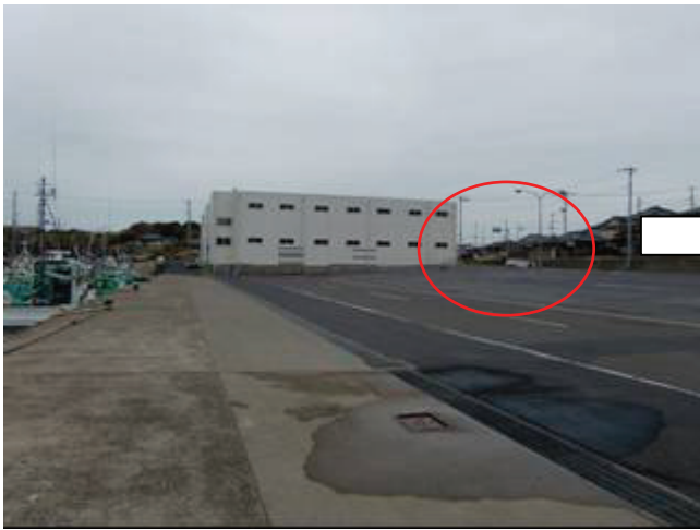
写真 18 外川漁港（西側）