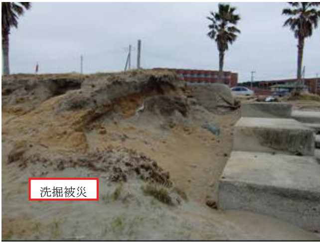
写真 28 銚子マリーナ海水浴場(洗掘被災)