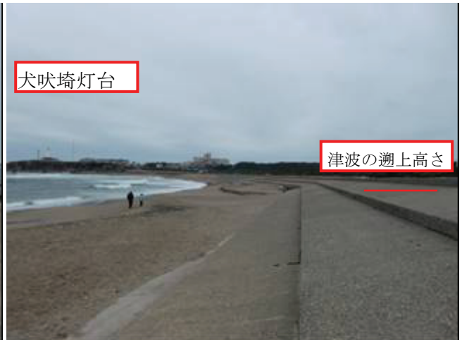
写真 15 君ヶ浜護岸