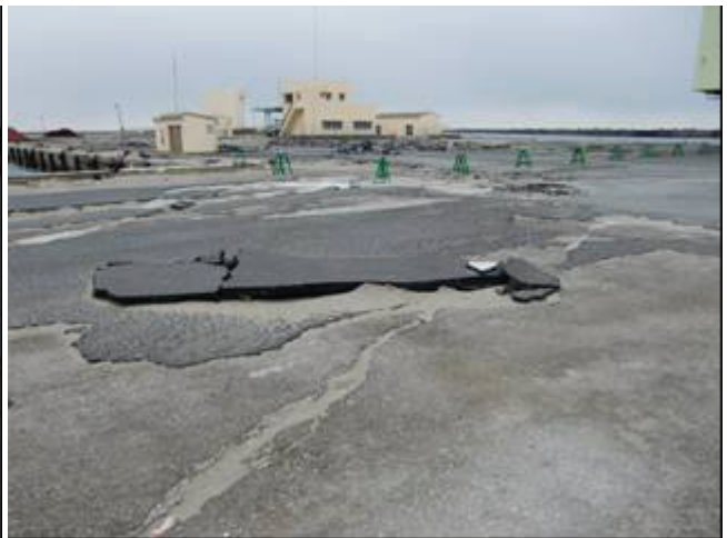
写真 29 亀裂とアスファルトの剥がれ