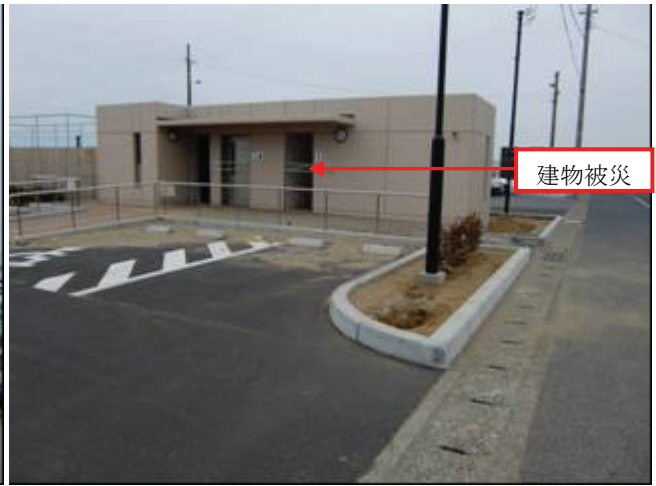
写真 19 外川漁港（公衆トイレ）