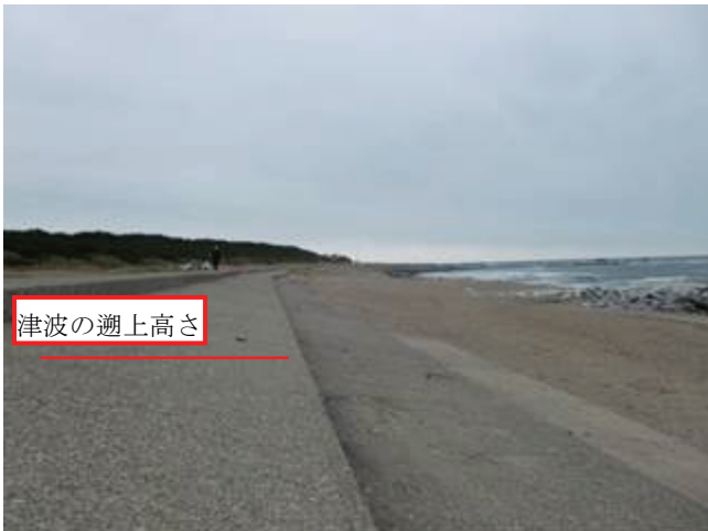
写真 14 君ヶ浜護岸

地震被害は確認できない。津波は防波堤と護岸を超えたことを聞き取りで確認。数日前に海岸のゴミ回収が行われた。(聞き取り調査による)