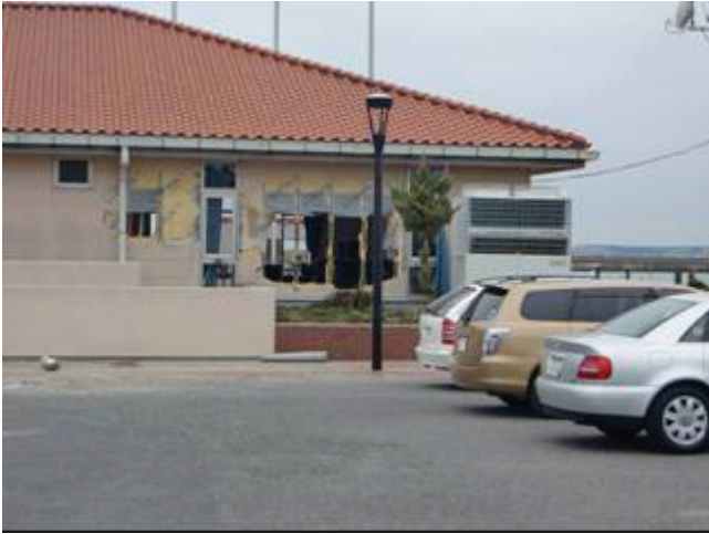
写真 22 銚子マリーナ(建物被災)

地震被害は確認できない。津波による建物やフェンス、係留施設やプレジャーボートの被災