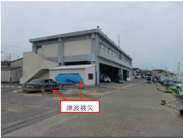
写真 18 外川漁港（市場）