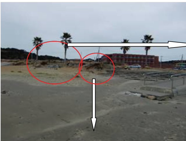
写真 26 銚子マリーナ海水浴場(洗掘被災)