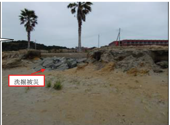
写真 27 銚子マリーナ海水浴場(洗掘被災)