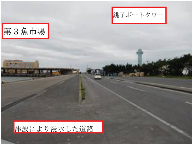
写真6 第3魚市場付近道路(津波遡上有り)

この地区の地震被害は認められない。津波は防波堤開口部から入り、魚港脇の道路から1ブロック奥まで遡上したことを、砂・ガレキの存在および聞き取りで確認。数日前に清掃作業が行われていた。