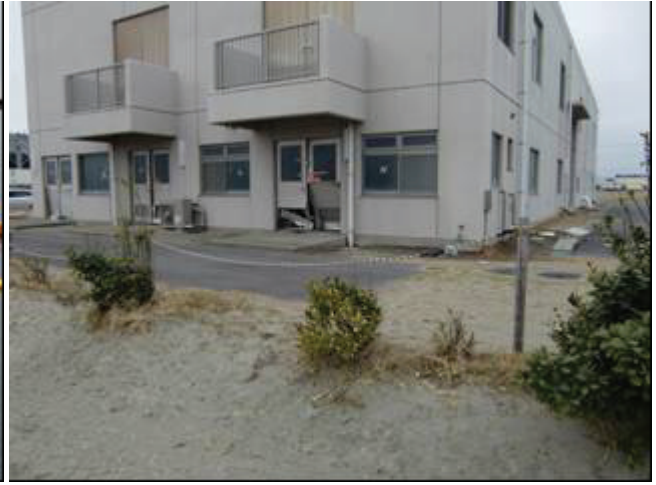
写真 32 津波による建物被災