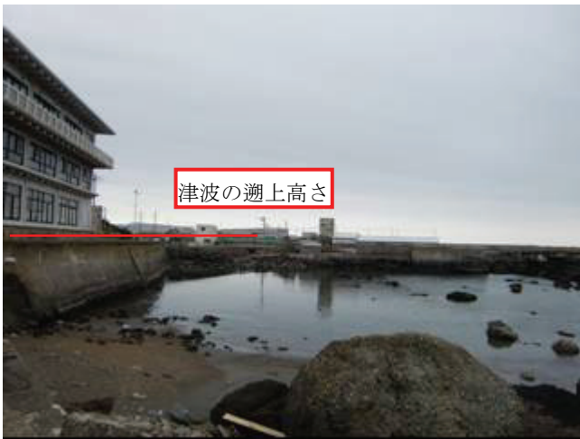
写真 12 黒生地区