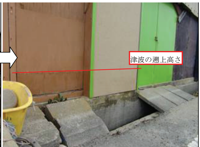
写真 17 外川漁港（東側）