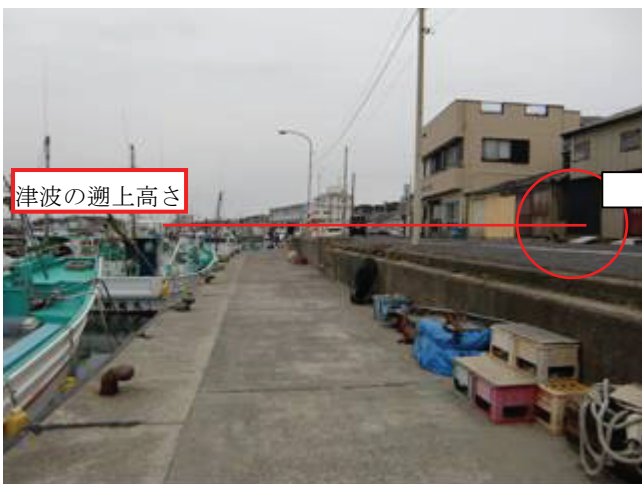
写真 16 外川漁港（東側）

地震被害は確認できない。津波は防波堤開口部から流入し護岸を超え、港中央付近で最も浸水が大きく、自動車や家屋の一部が被災したことを踏査および聞き取りで確認