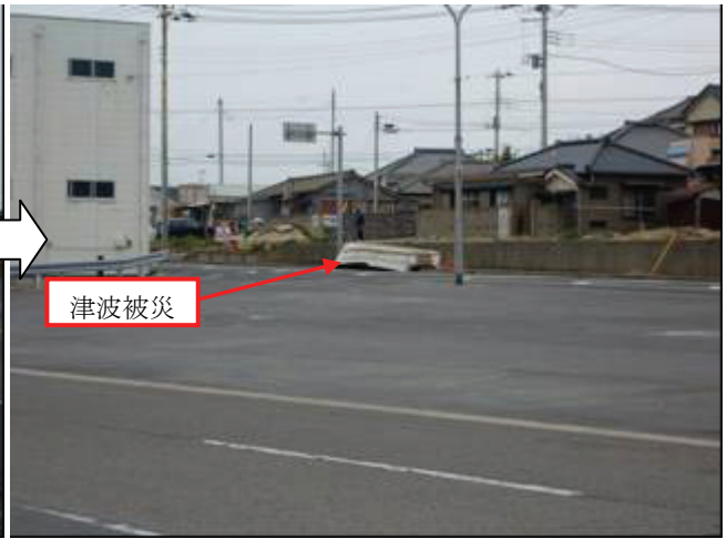
写真 19 外川漁港（西側．遡上の痕跡）