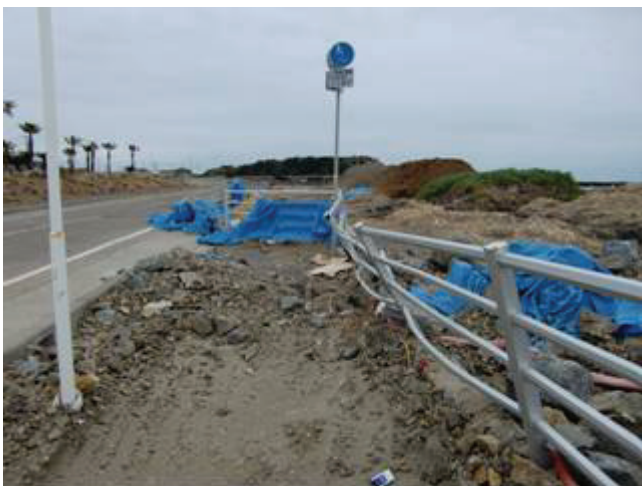
写真 20 犬若漁港付近(フェンス)