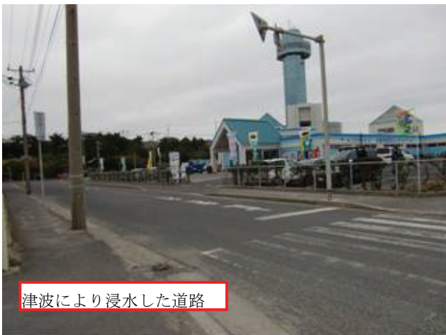
写真8 第3魚市場付近