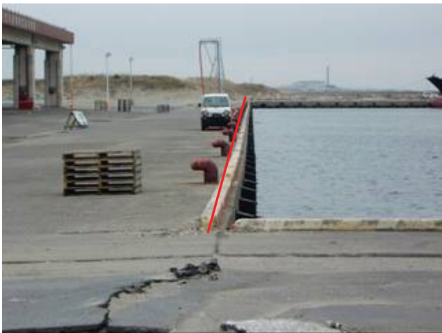
写真 28 亀裂と岸壁のせり出し写真

地震による亀裂とずれによる岸壁のせり出しが確認された。亀裂ができた舗装面は津波によって剥がされている。津波によって転覆した船が確認できた。