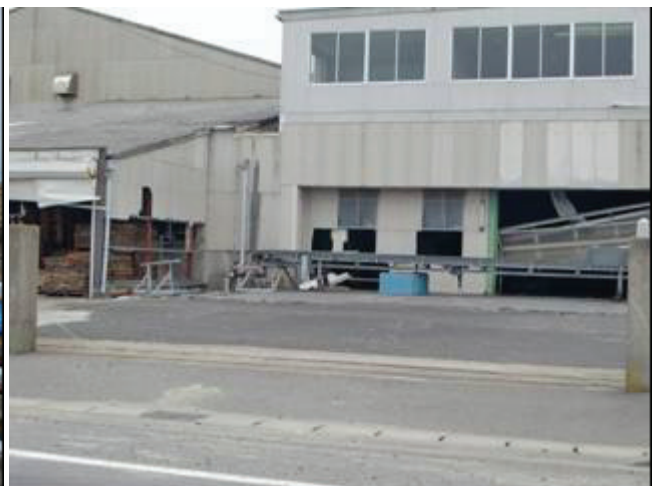
写真 21 犬若漁港付近(建物被災)