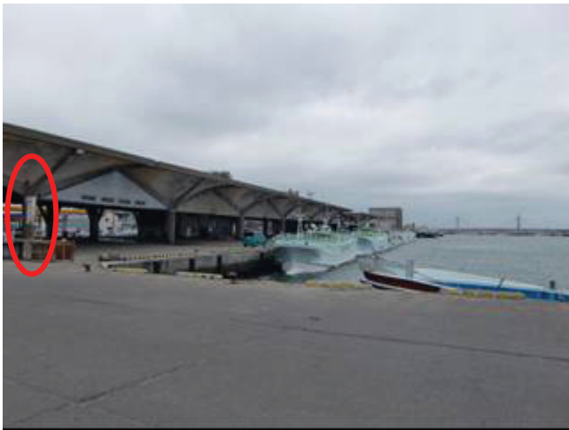
写真1 第1魚市場（港側から）

なお、津波は港の開口部から入り、岸壁を越えて写真2の道路まで浸水したことを聞き取りで確認。