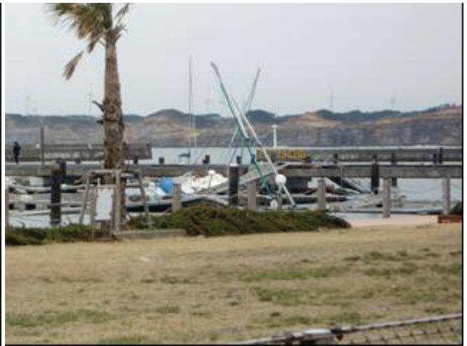
写真 25 銚子マリーナ(船&係留施設の被災)