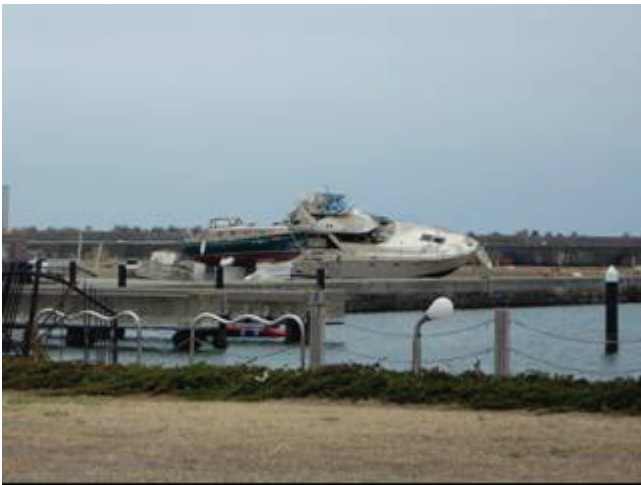
写真 24 銚子マリーナ(ボートの被災)