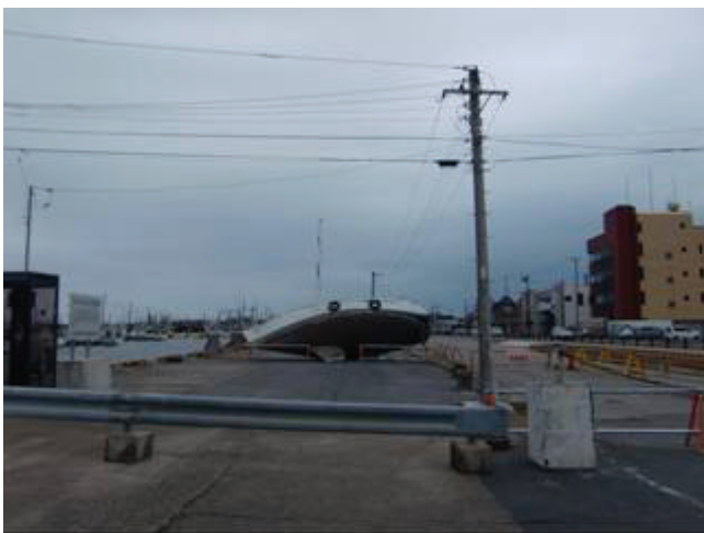
写真5 被災した船(現位置が津波によるものか不明)