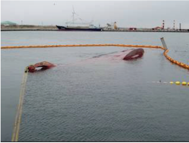
写真 31 転覆した船舶