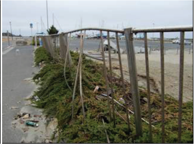
写真 23 銚子マリーナ(フェンス被災)