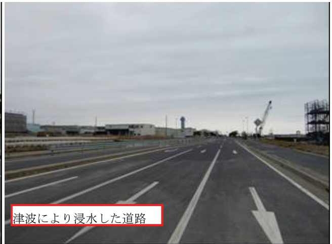
写真7 第3魚市場付近道路(津波遡上有り)