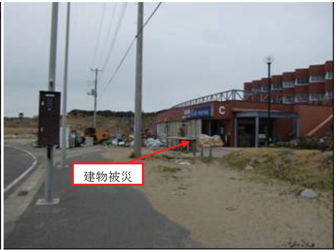
写真 27 銚子マリーナ海水浴場付近(建物被災)