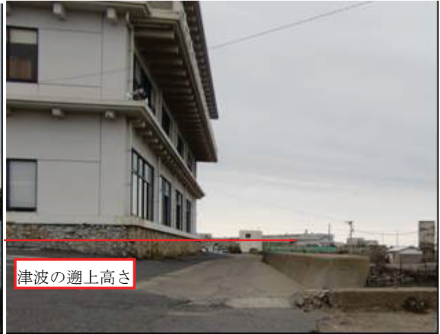
写真 13 黒生地区