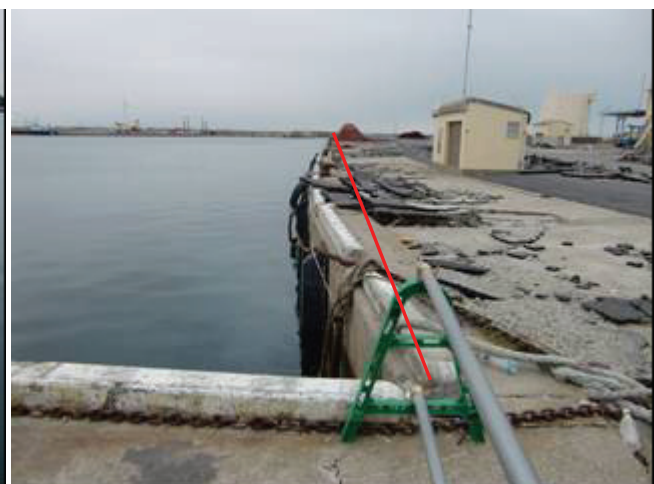
写真 30 亀裂と岸壁のせり出し