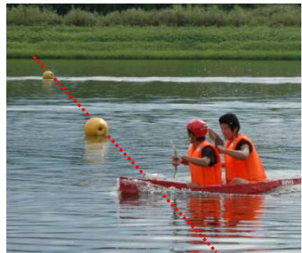
図-1 レースのコース