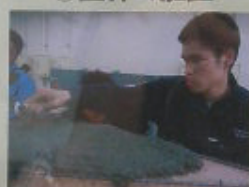
⑥モルタルの塗りつけ