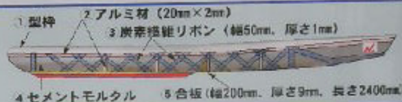
図-1 補強部材の配置

補強材は、型枠の全面を、ビニロン繊維メッシュで覆い、そのメッシュの上縁端部にアルミ材を2枚で挟み、アルミ材をボルトにより締めし付けした。このアルミ材が軸方向の補強材となる。また、軸直角方向は50cm間隔でアルミ材を配置し、ビニロン繊維メッシュとアルミ材をタコ糸で固定した。次に、炭素繊維リボンをX型に接着して骨組構造とし、軸方向と軸直角方向に配置したアルミ材でカヌー全体の補強材とした。さらに、主材料であるセメントモルタル1層目を打設し、その上にガラス繊維メッシュを貼り付け、2層目のセメントモルタルを打設し、全体の強度を高めた。また、クルーの重量に耐え得るようにカヌー内側底面に合板を設置し、曲げ剛性を高めた。補強部材の配置を図-1に示す。