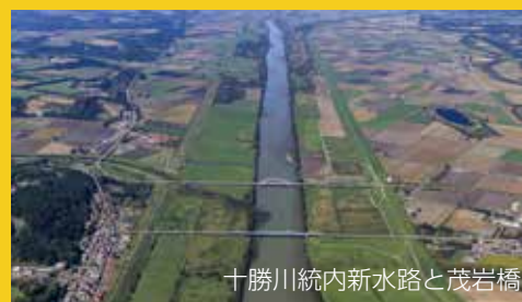
十勝川統内新水路と茂岩橋