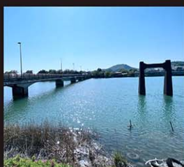
▲大正期に近代吊橋として建設された旧山川橋の主塔が遺されており、その上部を左岸側に見ることができる。