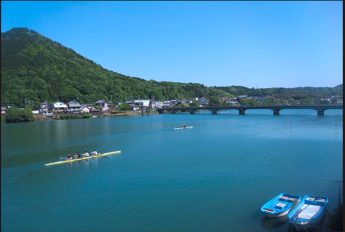
上流右岸側からみる山川橋の風景。傍らに米田富士と呼ばれる愛宕山が聳える。湖面はボートの練習場として盛んに利用されている。

1938（昭和13）年に完成した川辺ダムは、満州事変以降の電力需要の高まりに応じて東邦電力によって開発された発電用の施設である。このダム上流1kmの地点で県道川辺八百津線が吊橋（旧山川橋）で渡っていたが、路面がダム湖へ没する計画だったため、岐阜県土木課が東邦電力の寄附（11万円）を用いて架け替えた。これが現存する山川橋である。ゲルバー式RC造で、竣工当時から「白帯を渡せるが如き其の白一線は東岸に聳ゆる米田富士の秀峰と相俟つて、鏡の如き湖面に相映じて風光一段の美を加ふ」とその風景美を愛でられている。