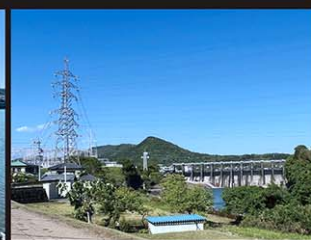
▲下流の川辺ダムと川辺発電所。背景にみえる際立つ峰は、山川橋に近接する「米田富士」と愛でられている愛宕山。