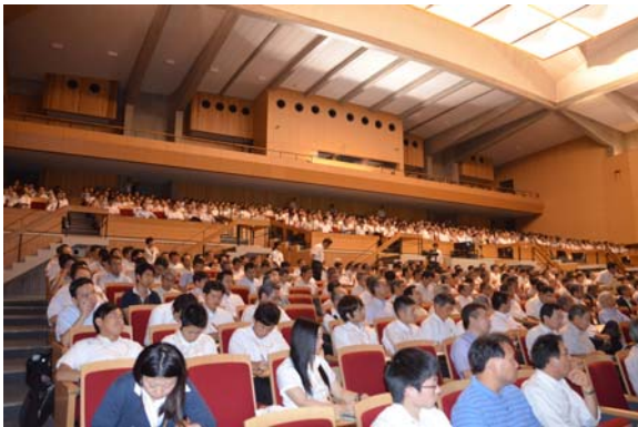
メイン会場: 豊田講堂