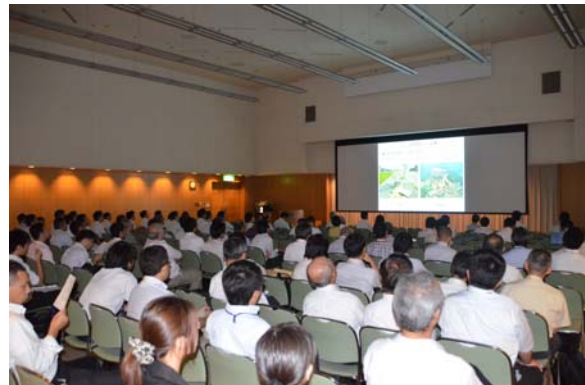
サブ会場: 豊田講堂内シンポジオン