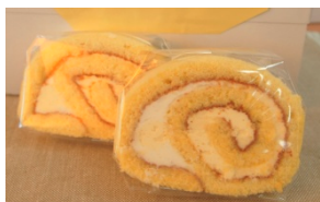
『愛大ロール (みかんロールケーキ)』

横から見ると愛大ブランドマークに見えるように、みかんクリーム巻き方を工夫しました。クリームや生地に愛大附属農場でとれた温州みかん果汁を混ぜ込んでおり、ミカンのさわやかな味がお口いっぱい広がります。冷凍で1本物もありますので、クール便での発送も可能です。