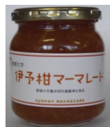
『伊予柑 マーメラード』

愛媛で有名な辛口のお酒・小富士を作る島田酒造さんにお作りいただきました。使用した米は、愛大附属農場で作った「安心米」のみを使用。辛口ですがフルーティな喉ごしは、冷酒でも常温でもお楽しみいただけます。料理の邪魔をしない美味しいお酒に仕上がっています。