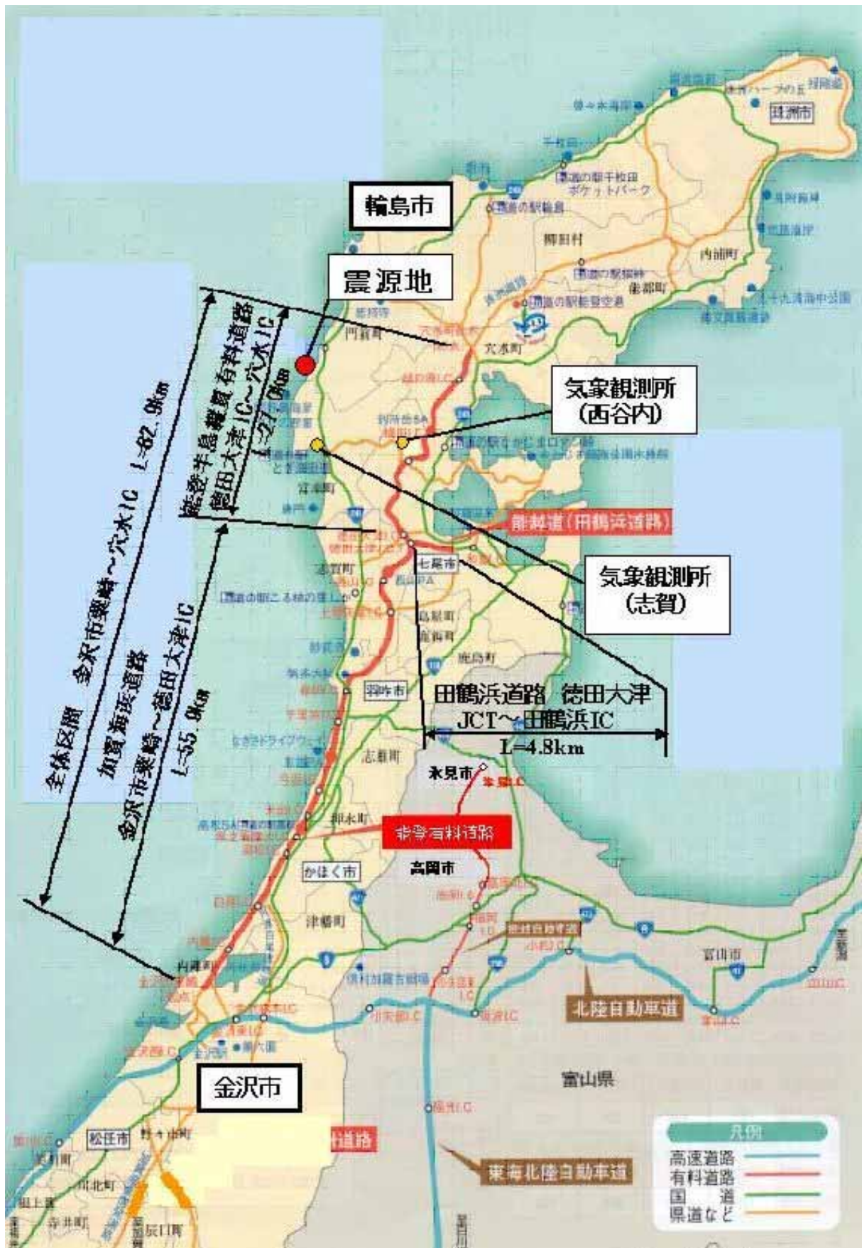
図 5.1.1-1 位置図