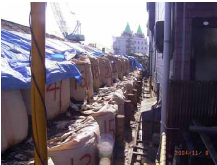
写真5 写真4ののり尻付近の詳細