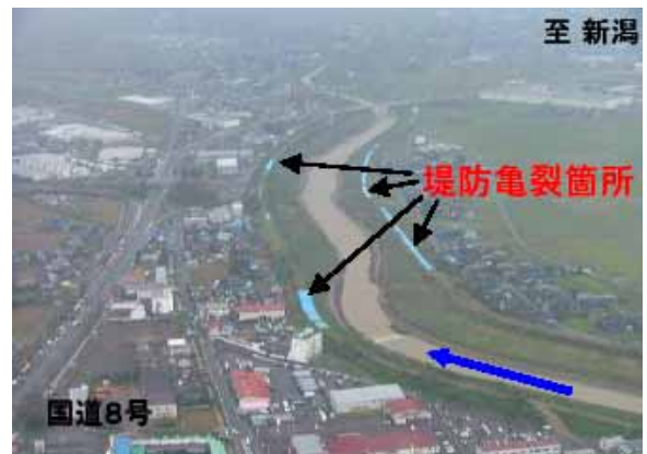
写真 1 土堤の被害状況と被災位置（新潟県土木部河川管理課の HP: