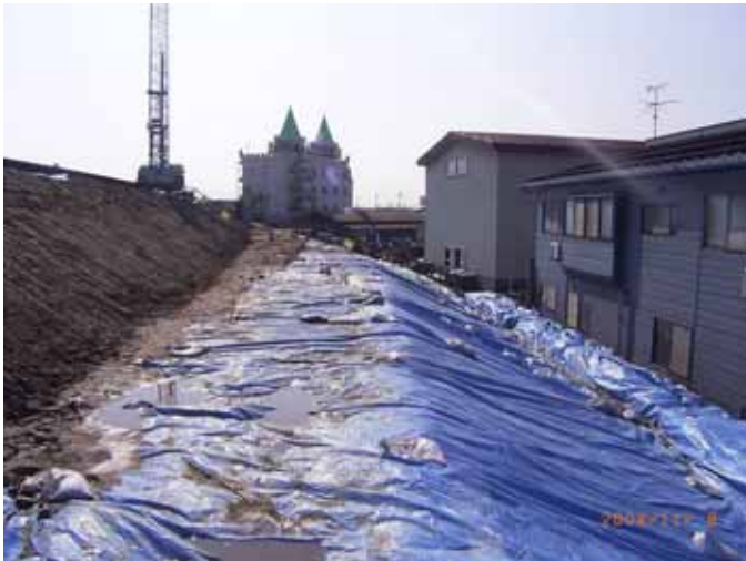
写真4 堤内地側での堤防の応急復旧状況