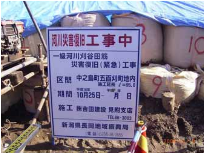
写真3 堤防のり尻で行われていた地盤調査箇所での表示