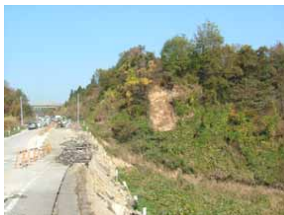
写真 2 盛土崩壊箇所 1 の状況(越後川口 IC 方向)