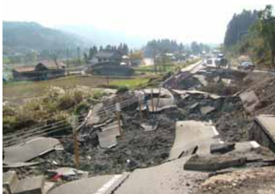
写真 3 盛土崩壊箇所 2 の状況(川西町方向)