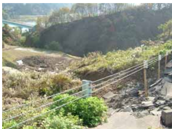
写真 1 盛土崩壊箇所 1 の状況(川西町方向)