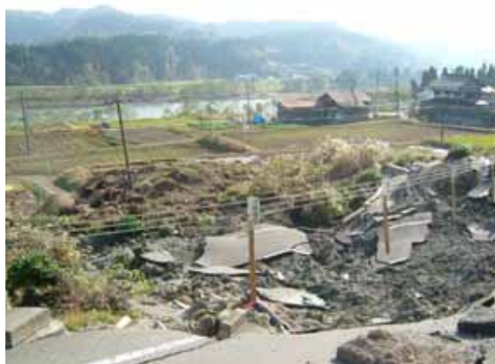
写真 4 盛土崩壊箇所 2 の状況(崩壊状態)