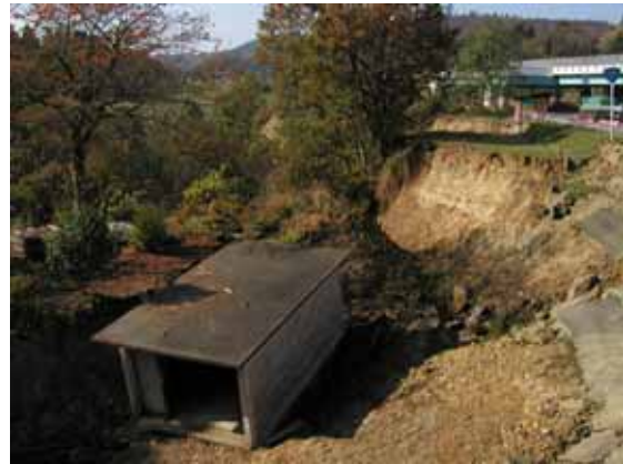
写真 2 塩殿 A での斜面崩壊(全体像：拡大)