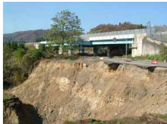
写真 4 塩殿 A での斜面崩壊状態(図 1 中の 2)