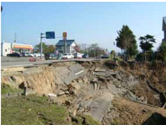
写真 3 塩殿 A での斜面崩壊状態(図 1 中の 1)