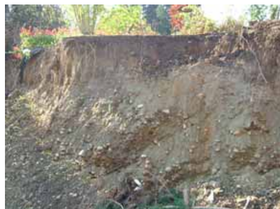
写真 6 塩殿 A における斜面崩壊地点の土質例(礫混じり粘土)