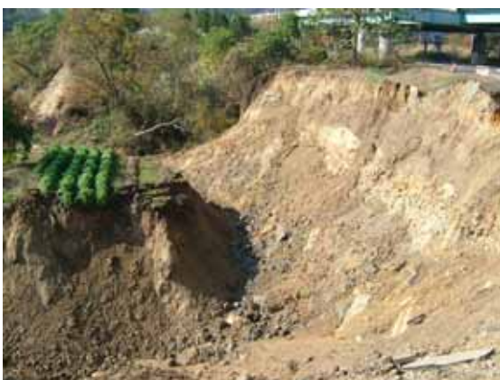
写真 5 塩殿 A での斜面崩壊状態(すべり土塊と地盤の層構造：図 1 中の 2)