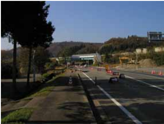
写真 1 塩殿 A での斜面崩壊(全体像：大崩壊 2 カ所)