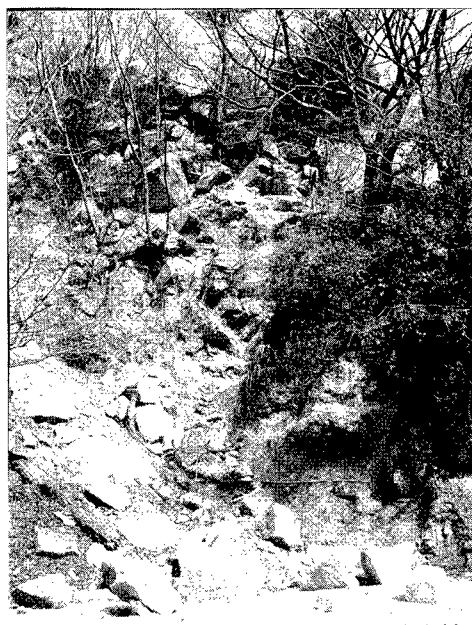
写真-2 芦屋市奥山 対策工無し