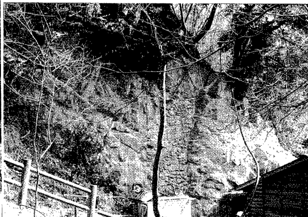
写真-3 同左、平成5年対策工施工済