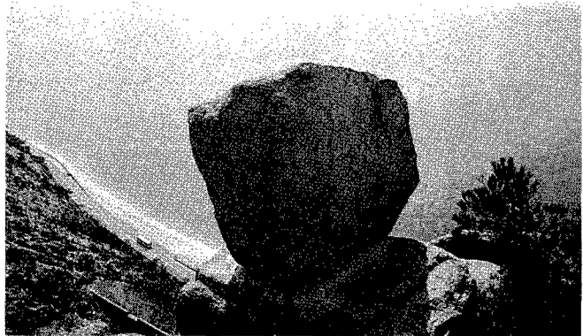
写真-1 DKボンド工法の一例（道路防災工事）

一般の法面被覆工と異なり、施工後の景観が従前と改変することなく、また工程中大半が人力施工であるため騒音、振動等の環境対策が比較的容易であり、世情に適合した工法であると言える。