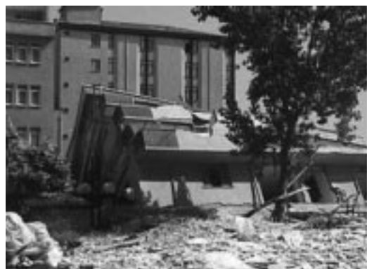
写真-3 Istanbul (Avcilar) での被害

布されていないという悔しさがある。トルコの民間テレビや国営放送のテレビ・ラジオ等でも地震火災に際して、日本のように自動的に震度情報などが放送機関に流れるというシステムはトルコにはいまだ整っていない。