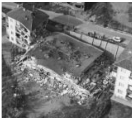
写真-4 バンケーキ破壊