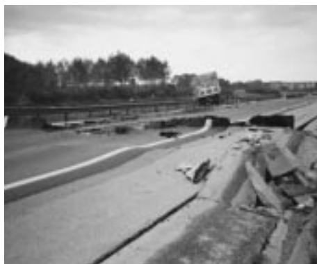
写真-5 トルコ・コジャエリ地震で破壊された高速道路