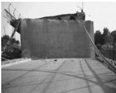
写真-2 トルコ・コジャエリ地震での高架道路