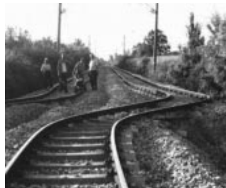
写真-6 地殻変動で湾曲した線路

にも大打撃を与え、特に地震の震源地であったコジャエリは、トルコ北西部の重工業と金融機関が集中する経済の心臓部であったから民間部門の損害も GNP 国民総生産に対し 80 % に達し 2 兆 2 千億円の被害に上った。今後、トルコのこの地震帯には繰り返し地震が発生するであろうと予想される。被害対策の確立がトルコにとっての急務である (図-2)。