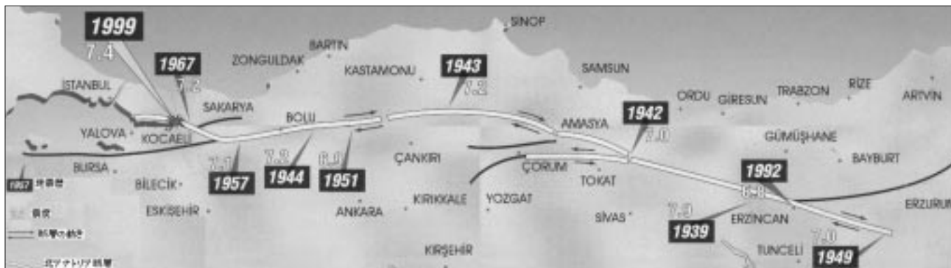
図-1 トルコで発生した地震地帯と北アナトリア断層