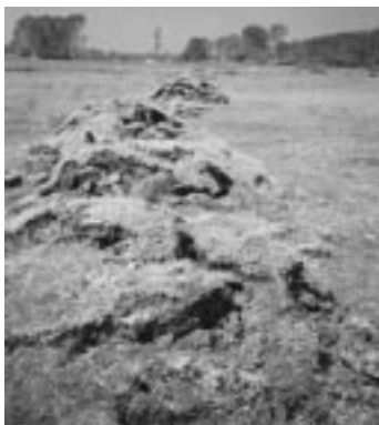
写真-1 トルコ・コジャエリ地震の断層