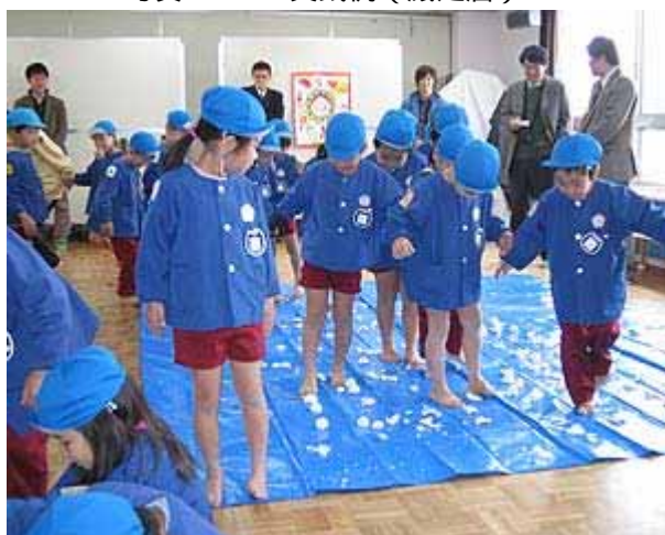
写真 6.5.3 実践例（災害体験）