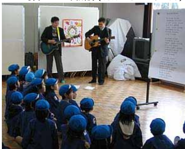
写真 6.5.4 実践例（防災の歌）

写真の子供たちの表情をごらんいただきたい。興味津々の表情を示しており、効果的な防災教育が実施できていることが伺える。もちろん、その後のフォローアップや基本理念3：地域への防災教育の発信や基本