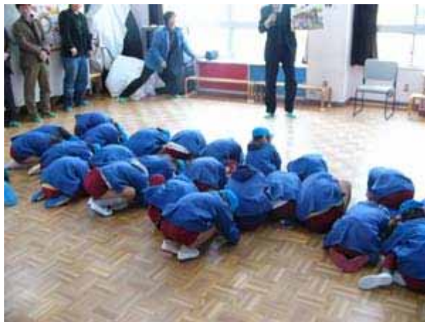
写真 6.5.2 実践例（だんごむしのポーズ）