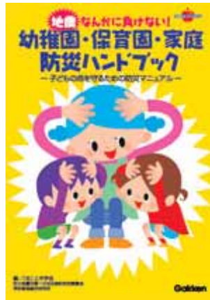
図 6.3.2 『地震なんかに負けない！ - 幼稚園・保育園・家庭防災ハンドブック』