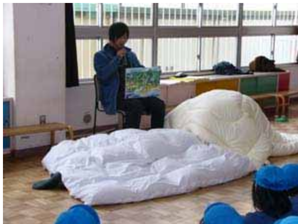
写真 6.5.1 実践例（紙芝居）

簡単に実践例の概要を述べると、呉市の保育所では、(1)紙芝居「じしんなんかにまけないよ」(写真 6.5.1)、(2)防災訓練「だんごむしになるう！」(写真 6.5.2)、(3)災害体験「はだしじゃいたいよ！」(写真 6.5.3)、(4)防災の歌「じしんだ！だんだん」(写真 6.5.4)の4つの内容で実施された。どの内容も、ハンドブックで紹介されている内容である。