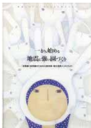
図 6.3.1 作成したハンドブックの表紙