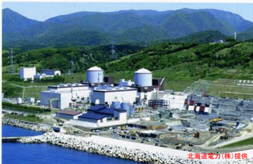
Tomari Power Station Tomari, Hokkaido