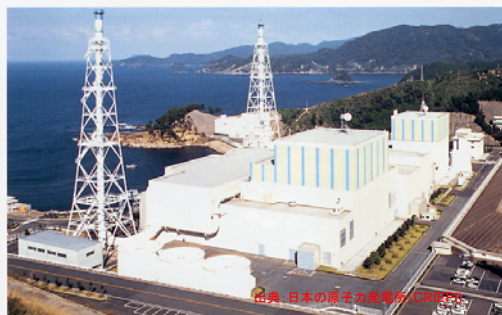
Shimane Nuclear Power Station ●Kashima-cho, Yatsuka-gun, Sh