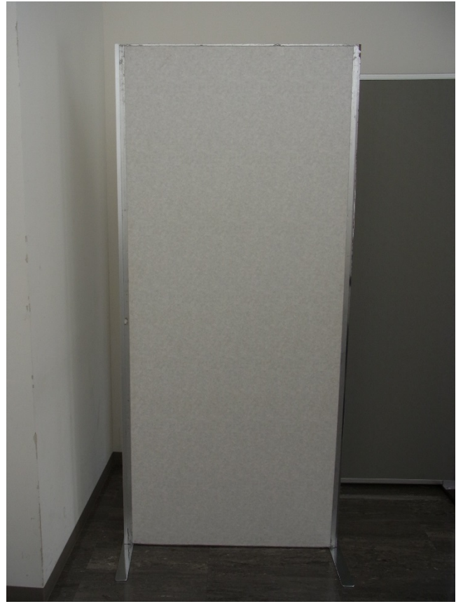
図1 ポスター掲示用パネルの概要