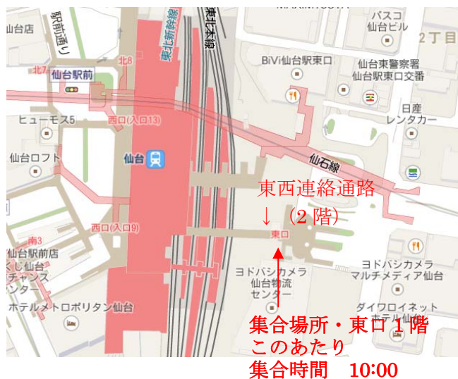
集合場所イメージ

※東西出口の連絡通路は 2 階に位置しています。貸切バスの発着場所が未定のため、東口 1 階の連絡通路の下あたりに集合してください (地図参照)。