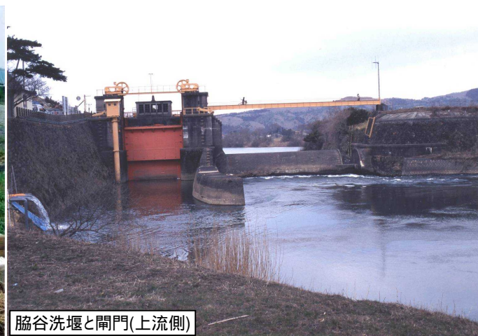
脇谷洗堰と閘門(上流側)