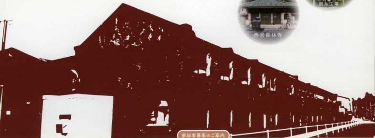
参加者募集のご案内