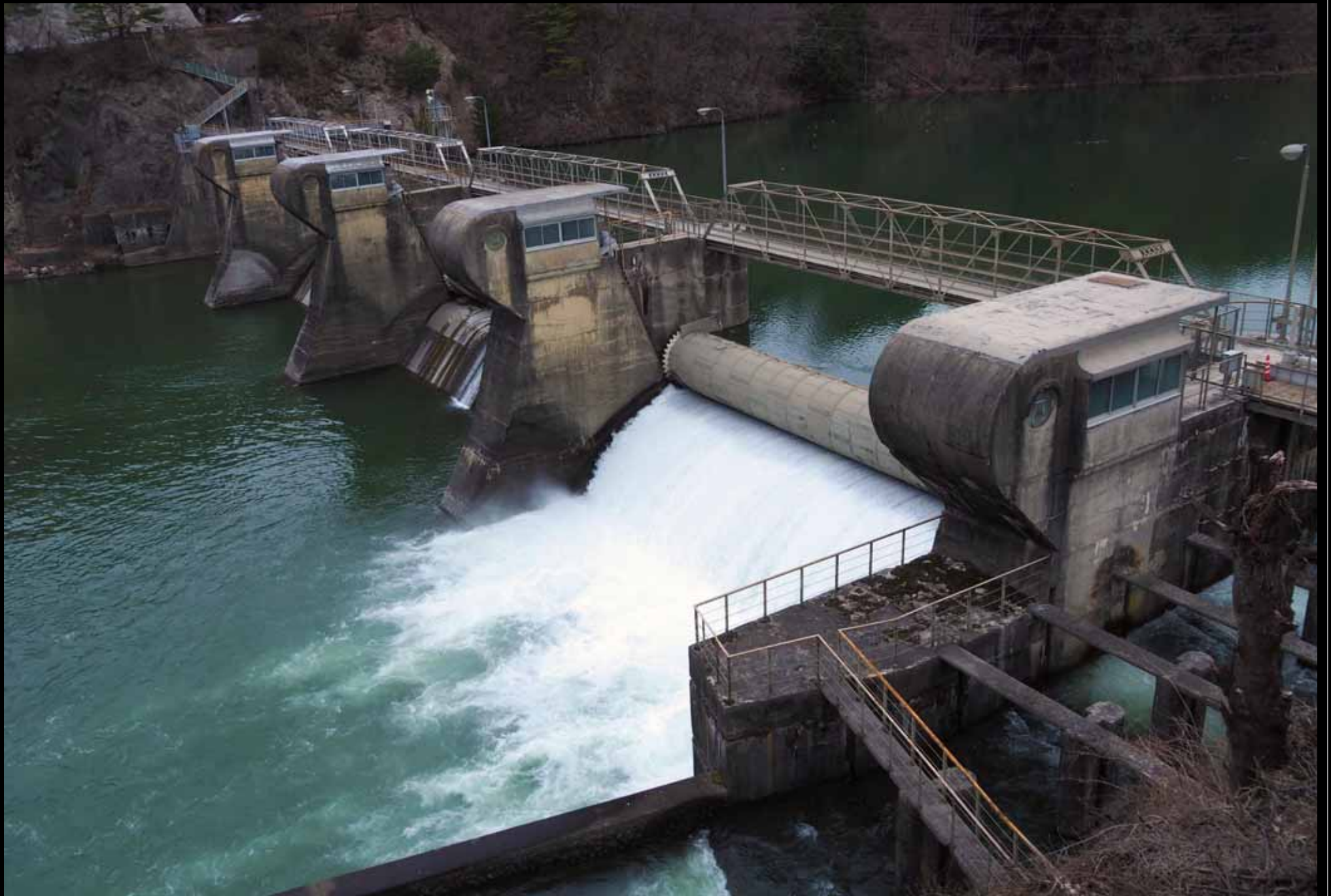
施設全景。R型のピアと回転しながら上下するドラム型の堰が特徴。