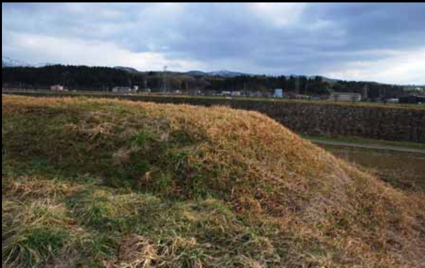
堤防の先端 向こうに次の堤防が見える。