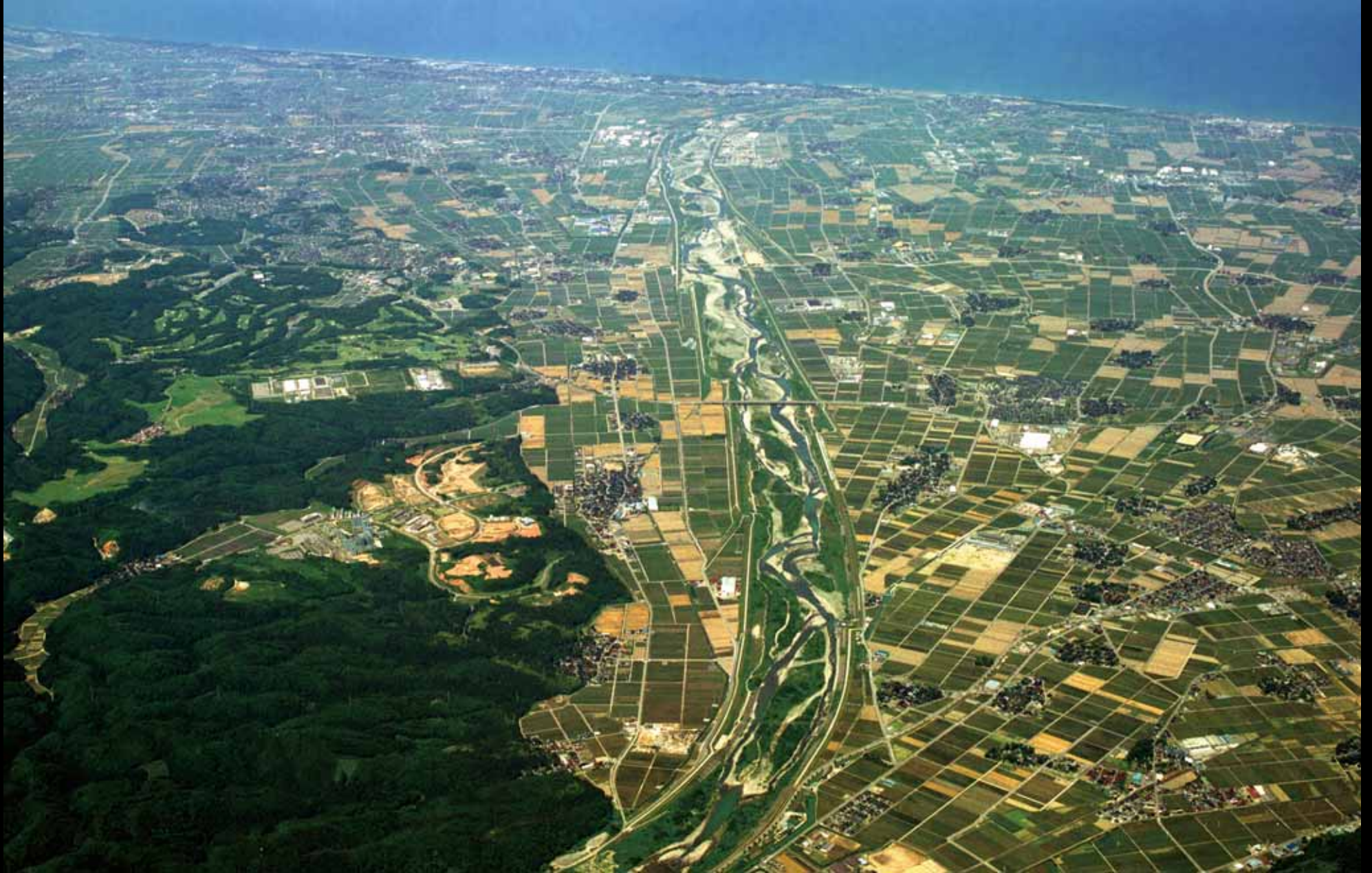
手取川の鳥瞰

認定理由：手取川の扇状地上に築かれた前近代の治水技術を伝える大規模で貴重な土木遺産であり、見事な不連続堤を遺している。